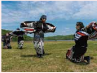
アイヌ古式舞踊(ユネスコ無形文化遺産) 短編映像上映「カムイユカラ」