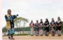
アイヌのくらしと 文化解説 「コタン語り」