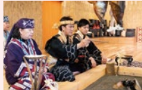
文化解説 プログラム