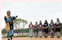
アイヌのくらしと 文化解説 「コタンの語り」