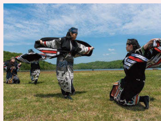
アイヌ古式舞踊(ユネスコ無形文化遺産) 短編映像上映「カムイユカラ」