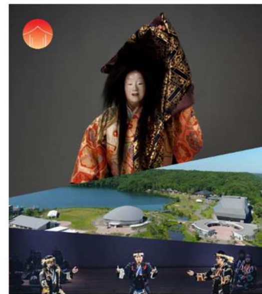
日本全国 能楽キャラバン！ウポポイ特別公演 能楽とアイヌ舞踊、 白老の地で舞い踊る 2023.7.30.Sun ウポポイ特設舞台 開演17:00 主催：公益社団法人能楽協会 共催：公益社団法人アイヌ民族文化財団