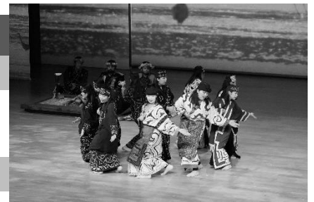
伝統芸能上演「イノミ」特別公演