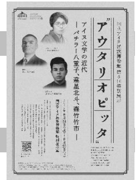
博物館第6回特別展示