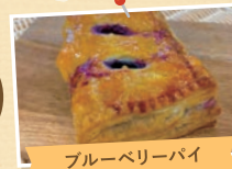
ブルーベリーパイ