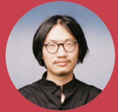
KIZEN / 趙儂然

東京を拠点とする中国雲南省出身のフォトグラファー。一貫したアートディレクションに加え、巧みなライティングと構成力でメッセージ性がある写真表現が強み。モード誌などのエディトリアル、広告を中心に国内外で活躍。