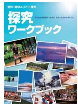
ワークブック（表紙）