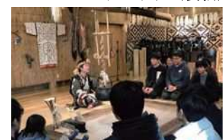
ウポポイで働く職員との交流