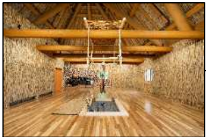
우포포이 전체 모습

자연이 풍요로운 환경 속에서 우포포이는 선주민족 아이누의 역사와 문화를 주제로 한 일본 최초이자 일본 최북단에 위치한 '국립아이누민족박물관'과, 선주민족 아이누의 문화를 오감으로 느낄 수 있는 야외 박물관인 '국립민족공생공원'과 같은 핵심 구역으로 구성되어 있습니다. '국립민족공생공원'에는 아이누의 전통 문화를 소개하는 체험 교류 홀과 전통 코탄(마을) 등 다양한 시설이 있습니다.