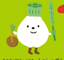
ウポポイPRキャラクター トウレツポン