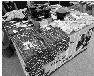
昨年のアイヌアートショーの様子