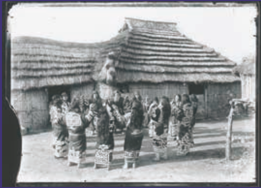
白老コタンのリムセ(踊り) 大正～昭和初期

アイヌはあらゆるものに魂が宿ると考え、私たちにない力を持つものをカムイと呼びます。カムイは、彼らの世界では私たちと同じような姿で暮らしており、私たちの世界に訪れるときにさまざまなものの姿になって現れるといいます。熊はキムンカムイと呼び、毛皮や肉はキムンカムイからの贈り物と考えられました。 イヨマンテは、そのカムイに感謝の祈りを捧げ、酒や歌、踊りでもてなし、土産とともにカムイの世界へ送り帰す重要な伝統儀礼です。