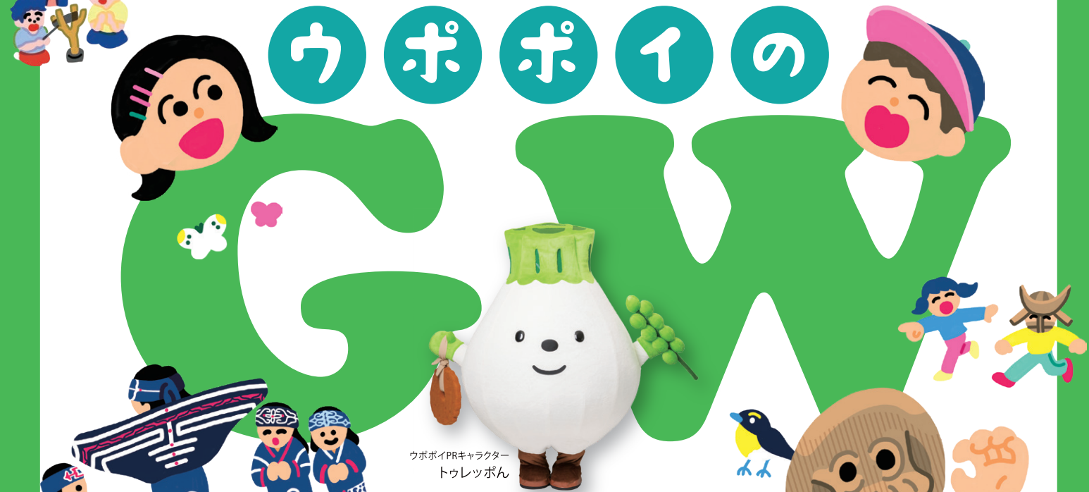
ウポポイPRキャラクター トウレットポん