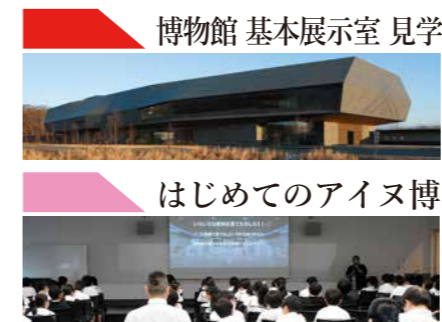
博物館 基本展示室 見学