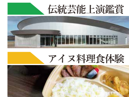
伝統芸能上演鑑賞