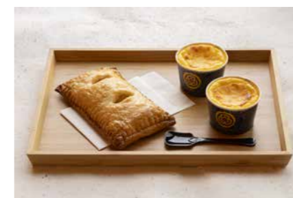
sweets café ななかまど イレンカ