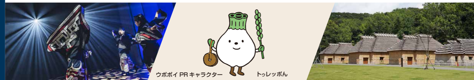
ウポポイ PR キャラクター トレッポポン