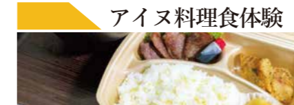
アイヌ料理食体験