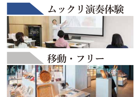
ムックリ演奏体験