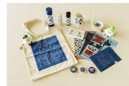
博物館 1F ミュージアムショップ

ウポポイ園内での自由時間などで、お土産の購入やご飲食利用ができる店舗があります。入場ゲート外の店舗ご利用でも再入場が可能です。