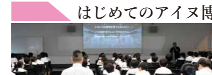
はじめてのアイヌ博