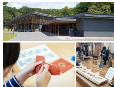
エントランス棟・歓迎の広場 ホッキアンチセ・ウウエランカラップミンタラ

スタッフが製作した工芸品や素材の展示を見学できるほか、木彫や刺しゅう体験、ムックリやトンコリといった伝統楽器の体験もできます。